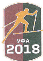
ТАБЛИЦА ОБЩЕКОМАНДНОГО ЗАЧЕТА